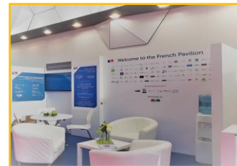
Photographie non contractuelle